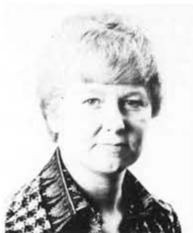
Birthe Rønn Hornbech. Cand.jur. 1971, politifuldmægtig i Roskilde 1971-76. Ansat hos rigspolicehøveden siden 1976. Vicepolitimester i 1982. Medlem af Folketinget 1984-87.