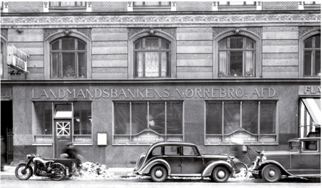
Landmandsbanken på Nørrebrogade hvor røveriet fandt sted den 29. marts 1951.

D et var koldt, og sneen dækkede stadig Nørrebrogade, selvom kalenderen skrev den 29. marts 1951.