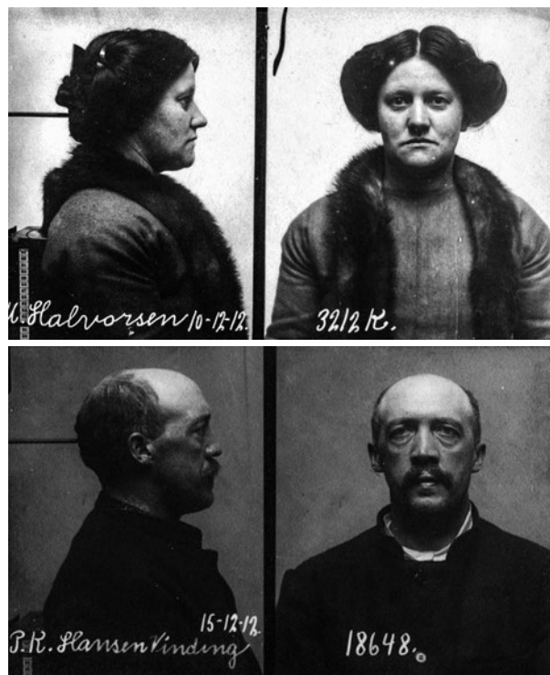
Forbryderfotografier af Marie Kock og P.K. Hansen-Vinding

Hertil kom flere bedragerisager, i hvilken forbindelse Hansen-Vinding blandt andet havde forfalsket sin fars underskrift. Endelig forlød det, at han havde voldtaget en pige på sin hjem- egen. Hun blev efterfølgende eftersøgt, men aldrig fundet, da hun angiveligt var emigreret til USA.