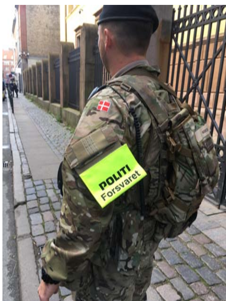
Soldat på Krystalgade under politiets kommando.

Udviklingen i forholdet mellem politi og forsvar, herunder de nævnte lovændringer, beskrives senere i artiklen, jf. afsnit 3. Allerførst beskrives Jødefejden og de politimæssige forhold i årene omkring urolighederne, jf. næste afsnit 2. Med henblik på at belyse Jødefejden ud fra artiklens fokus på politi og forsvar suppleres redegørelsen af hændelsesforløbet med indhentet empiri fra Rigsarkivet; en række centrale kilder og oplysninger er således blevet lokaliseret i Gardehusarregimentets arkiv i forbindelse med udarbejdelsen af denne artikel. 10