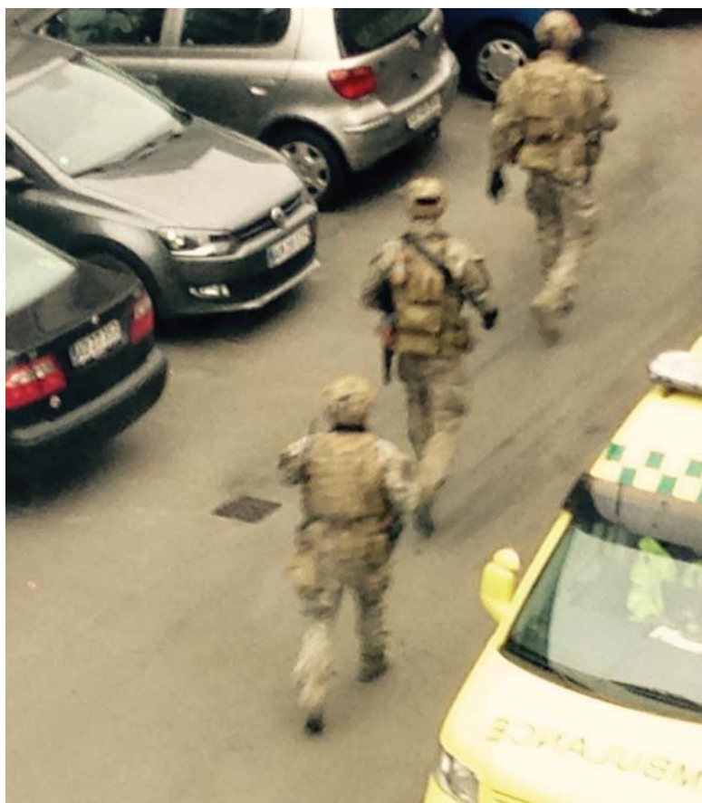
Politiaktion med camouflagede operatører på Østerbro d. 15. februar 2015.

militærrelateret træning. Denne diskussion skal ikke behandles i denne artikel men leder hen til at fremhæve nogle aktuelle drøftelser i Rigspolitiet fra 2017. Drøftelserne omhandler, hvorvidt personer fra Forsvarets specialstyrker skal kunne søge direkte optagelse i AKS. Vedtages dette, vil det fravige tidligere praksis, hvor kun politiuddannet personale har kunnet søge optagelse i AKS. Drøftelserne er sket som følge af konkrete udfordringer med at finde egnet personale i politiet, som kan bestå AKS's særlige og fysiske optagelsesprøver. 64 I forbindelse med udarbejdelsen af denne artikel har Politiforbundet bekræftet d. 27. august 2018, at forbundet er involveret i de pågældende drøftelser, der på nuværende tidspunkt fortsat er i gang. 65