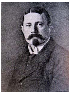
Palle Rosenkrantz 1867-1941.

Palle Rosenkrantz stammede fra en godsejerfamilie, han var af uddannelse jurist, og han startede som herredsfoged og fik hurtigt nogle erfaringer med retssystemet, også fordi han selv blev anklaget for underslæb (han levede over evne!)