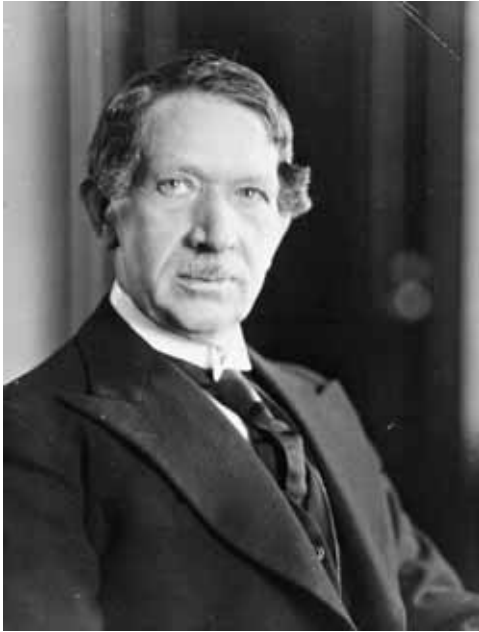
Eigil Thune Jacobsen, født den 1. oktober 1880. Statspolitichef 1933-36. Politidirektør i København 1936-38. Rigspolitichef 1938-41. Justitsminister 1941-43.

Thune Jacobsen blev i forbindelse med enhedspolitiets indførelse d. 1. april 1938 udnævnt til rigspolitichef.