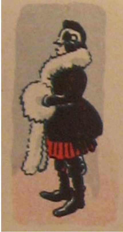
Klods Hans, årgang 12 nr. 8, 156.

Politidirektøren havde selv hentet en del oplysninger og erfaringer ind fra udlandet, der resulterede i, at han satte spørgsmålstegn ved de eksempler der var blevet fremhævet i det andragende Dansk Kvindesamfund havde indsendt. Bl.a. henvisningen til Chicago, der ifølge Kvinden & Samfundet allerede i 1882 havde ansat kvindelige betjente. Politidirektøren mente at disse aldrig: ” har eksisteret og har aldrig været kvindeligt politi ”. 58 De kvinder, der var ansat i Chicago fungerede ifølge ham mere som kvindeligt arrestopsyn og deres arbejdsopgaver kunne ikke betegnes som egentlig polititjeneste, men mere ses som opsyn eller filantropisk arbejde. 59 Han påpegede, at der allerede fandtes kvindeligt opsyn i fængslerne her i landet, hvor stationskoner og kvindelige hjælpere varetog opgaver som opsyn og visitation af kvindelige fanger. Derudover eksisterede der, som nævnt, samarbejde mellem politi og forskellige filantropiske foreninger, som tog sig af børn og kvinder. 60 Politidirektøren udtrykte et ønske om flere kvinder knyttet til politiet, men ikke kvindelige betjente, der skulle være inden for det eksekutive politi: ”... jeg kan ikke finde Benævnelsen kvindelig Politibetjent, der heller ikke anvendes noget steds, for heldig. ” 61