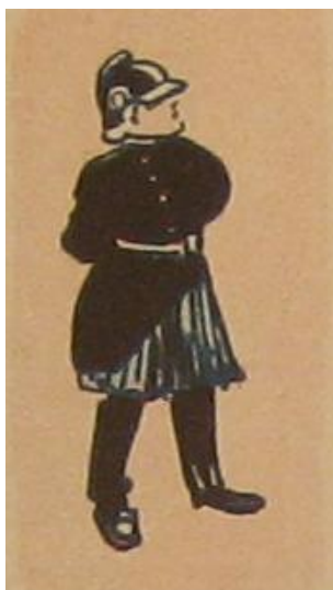
Klods Hans, årgang 12 nr. 8, 156.

Herudover blev det påpeget i andragendet, at en ansættelse af kvinder ville have stor betydning for politiet, da kvinderne kunne forebygge og genoprette, med den forestilling at de kvindelige betjente ville åbne op for forståelse af det som andragendet betegnede som ” triste skæbner .”