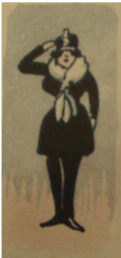
Klods Hans, årgang 12 nr. 8, 156.