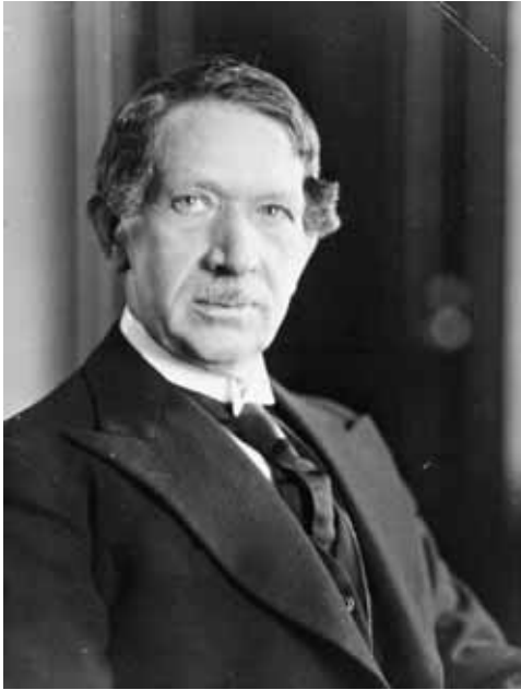
Eigil Thune Jacobsen, født den 1. oktober 1880. Statspolitichef 1933-36. Politidirektør i København 1936-38. Rigspolitichef 1938-41. Justitsminister 1941-43.

Thune Jacobsen blev i forbindelse med enhedspolitiets indførelse d. 1. april 1938 udnævnt til rigspolitichef.