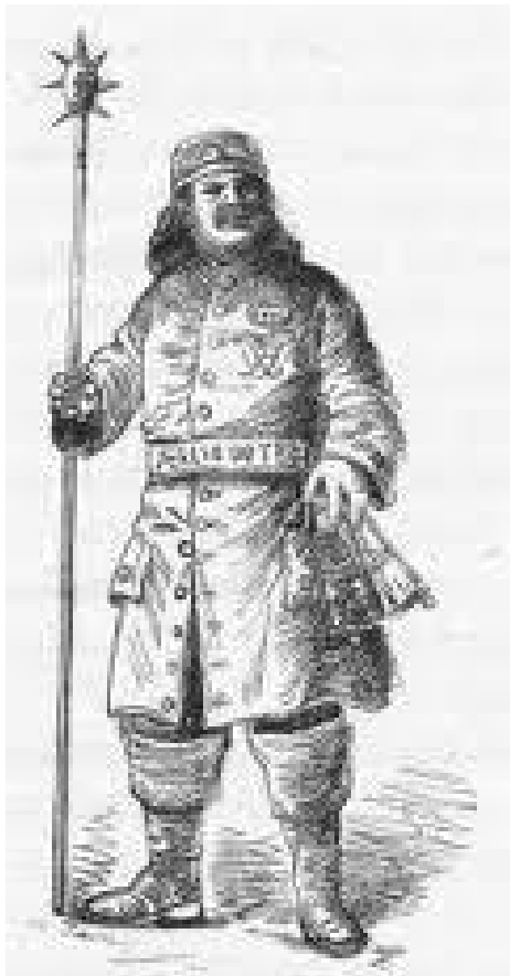
En vægter fra 1700-tallet

huset, og da gik slagsmålet på ny an. Vægterne førte en af dem i arrest på Rådhuset og opbragte en kårde og en pallask.