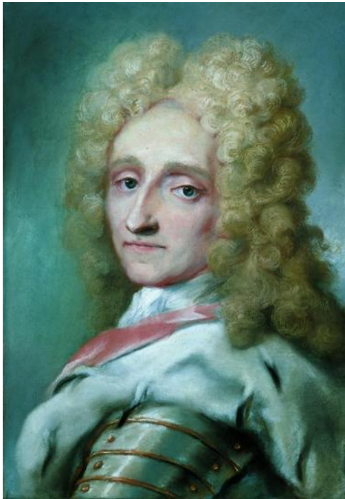
Frederik d. IV

Billedet er fra omkring 1709 og hænger på Frederiksborg