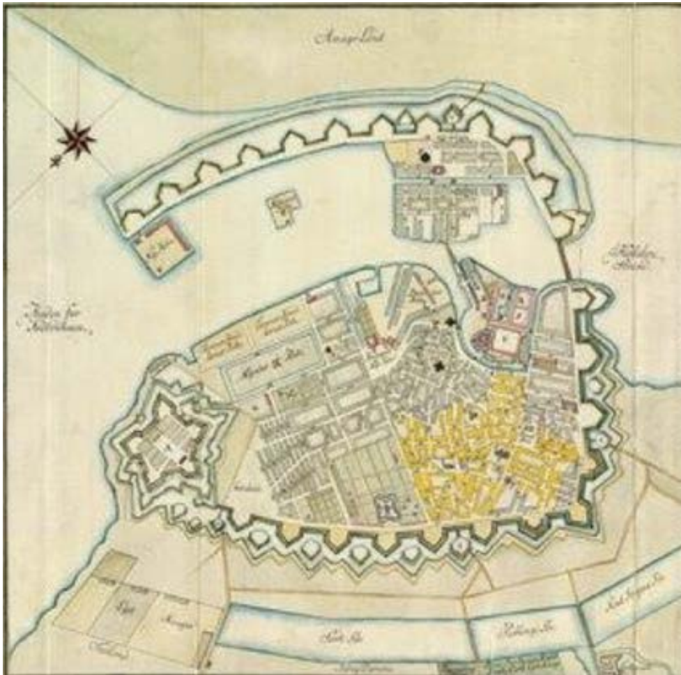
Kort over Kjøbenhavn fra 1700-tallet

Netop på denne tid var en ridende person set komme fra Nørregade ind i Skidenstræde. Han red ind på den dræbte underkonstabel og slog løs på ham med pisken, hvorved han tillige ramte hans kammerat, en anden artilleribetjent. Underkonstabelen bandede og råbte til ham: »Er gaden ikke bred nok?»