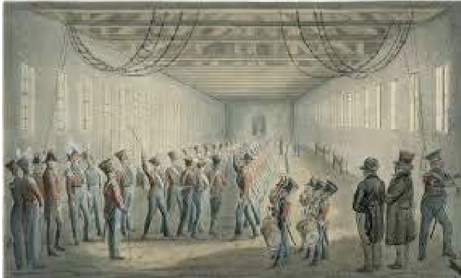
Udførelsen af spidsrod